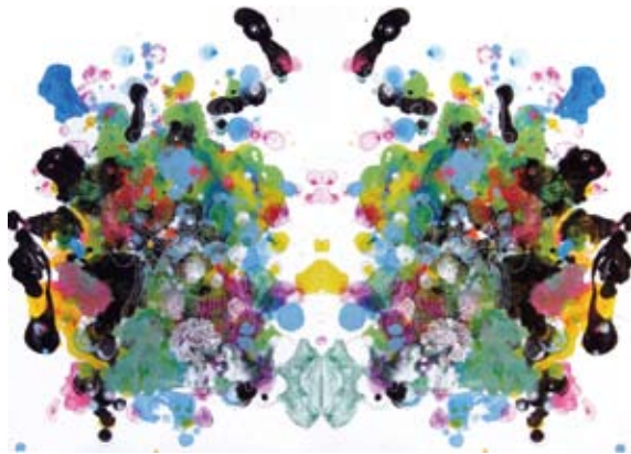
「Parallel」紙、アクリル、ペン 2012 (表面を含む、2点共)